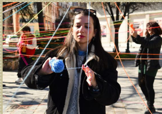
«Κινούμενα Τοπία / Beyond the Urban| Performing Ecosystems»